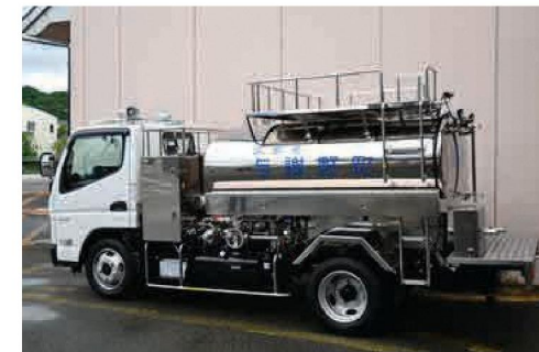
導入した加圧給水車（積載水量 2,800 リットル）

6月25日、地震や豪雨などの災害による断水時に迅速な給水活動を行うため、初となる加圧給水車（1台）を導入しました。加圧給水車は、給水タンクと加圧ポンプを備え、避難所や給水が困難な場所へ、効率的に給水活動が可能となります。災害時などの給水体制を強化し、住民の皆さんの生活を支える重要な役割を担います。与謝野町では今後も、防災・減災対策の充実を図り、安全・安心なまちづくりを進めていきます。