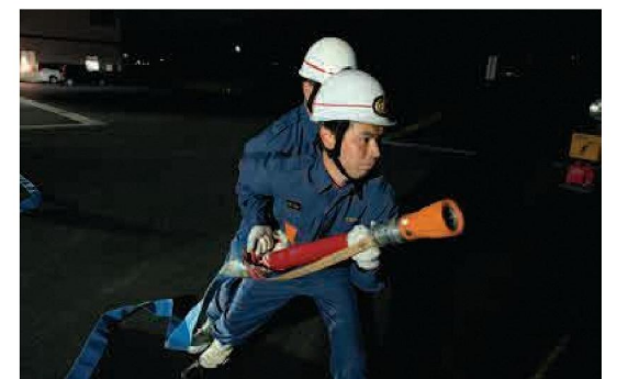
火点に向けて放水します

訓練巡視という大きな節目は終わりましたが、私たちの本当の任務はこれからです。今回の訓練で培った確かな技術と強い絆を胸に、これからも与謝野町の安心・安全のため、第6分団は全力で活動していきます。