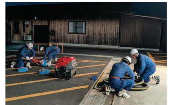
号令後、1番員はホースを、2・3番員は吸管を伸ばします

私たちは、いざというときにまちをしっかりと守り抜けるよう、仕事終わりに夜間訓練を重ね、基本動作の一つひとつにこだわりながら技術を磨いてきました。