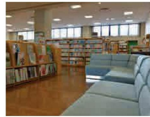
図書館本館の館内