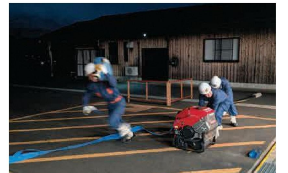
1番員はホース伸長後、火点に向かって走ります（左）

体力的にも決して楽なことばかりではありません。しかし、「自分たちのまちは自分たちで守る」という強い使命感と、地域の皆さんからの温かい声援があったからこそ、最後までやり遂げることができました。