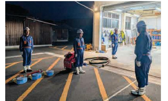
指揮者（右）からの操作開始の号令を待ちます

6月14日に実施された「消防団操法訓練巡視」において、私たちは日ごろの訓練の成果を披露しました。私たちが挑んだのは「小型ポンプ操法」。火災現場を想定し、小型ポンプの操作から火点（標的）への放水・消火に至るまでの一連の動作を、迅速かつ正確に行うための実践的な技術を培うものです。