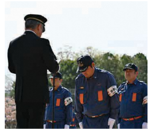
各分団長への辞令交付

与謝野町消防団は284人の体制となり、住民の皆さんの生命と財産を守るため、今後も地域に根ざした活動を続けてまいりますので、ご理解とご協力をお願いします。