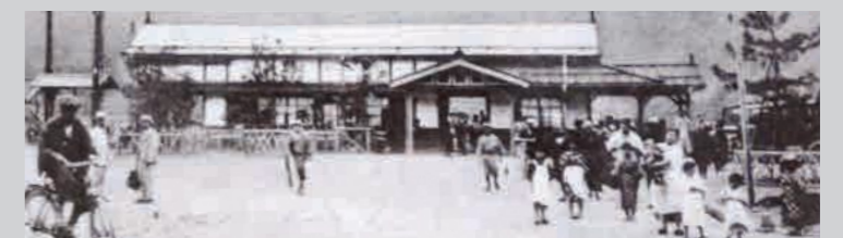
開業間もないころの丹後山田駅

老松の 1 枚板から作られた重厚で立派な駅名板と、その切り株から生まれた味わい深い碁盤。どちらも、加悦鉄道の歴史を今に伝える貴重な品です。もしかすると、右の写真に写る松がその材料となった木なのかもしれません。