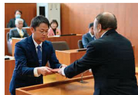
波尻委員長から当選証書を受け取る当選者