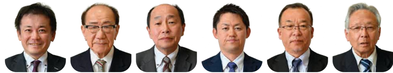
三河内 | 無所属 | 44 | 現 | 三河内 | 無所属 | 89 | 元 | 弓木 | 無所属 | 64 | 新 | 後野 | 無所属 | 41 | 新 | 三河内 | 無所属 | 66 | 新 | 金屋 | 日本共産党 | 71 | 現