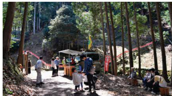
「滝のツバキ」の前でくつろぐ来場者の皆さん

4/12 春の恒例イベント「第33回滝の千年ツバキまつり」が開催され、咲き誇るツバキが来場者を魅了しました。