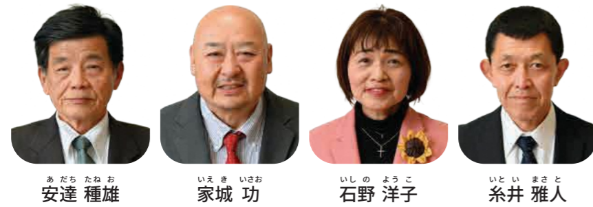
岩屋 | 無所属 | 80 | 現 | 三河内 | 無所属 | 61 | 現 | 幾地 | 日本共産党 | 68 | 新 | 岩滝 | 無所属 | 64 | 新

※ 氏名（50 音順・敬称略）、住所、所属、満年齢、現=現職・元=元職・新=新人）