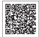
令和8年度登録団体の募集 (町ホームページ)

与謝野町では、多様な主体による協働のまちづくりを推進するため、地域の活性化や課題解決に向けて自主的に取り組む団体を「与謝野町ふるさとまちづくり活動応援補助金」で支援しています。このたび、本制度の対象となるまちづくり活動団体を募集します。なお、制度の詳細は町ホームページをご覧ください。お問い合わせ先は、企画財政課までお問い合わせください。