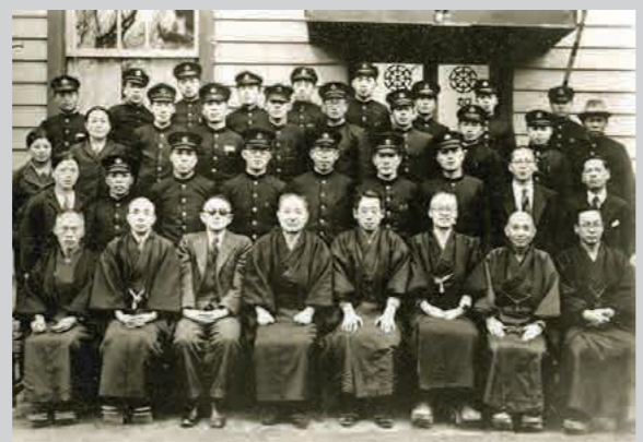
加悦鉄道開業10周年の記念写真

あわせて36人が写っており、ちりめん街道にゆかりのある方々の姿も見られます。また、10周年を記念して当時最新鋭の半鋼製片ボギー式ガソリンカー「キハ101」が新製されました。座席数26、定員50人の車両で、地域の人々の移動を支える存在となりました。