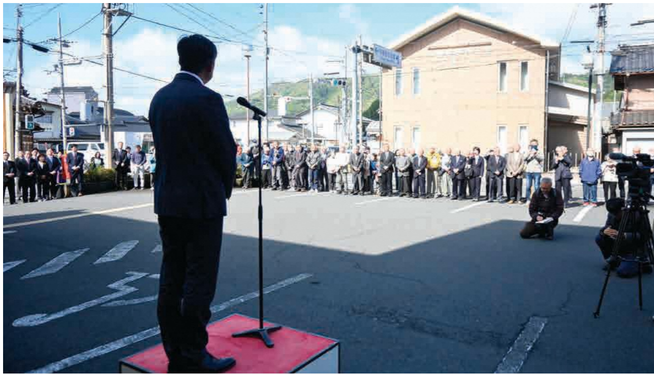
佐賀町長の就任のあいさつに耳を傾ける皆さん