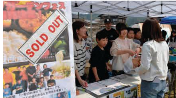
お弁当を手渡す児童たち

3/28 「ヨサノガーデンフェス 2026」が与謝野駅で開催され、多くの来場者でにぎわいました。