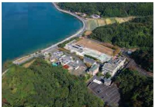
宮津湾浄化センターの航空写真

近年、このマンホールポンプに異物が流入して停止したり、ポンプに絡みついて故障する事例が多発しています。マンホールポンプ