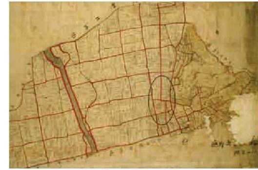
① 古絵図 (明治 19 年作成)