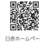
日赤ホームページ