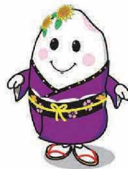
与謝野町マスコットキャラクター「あまのこ」