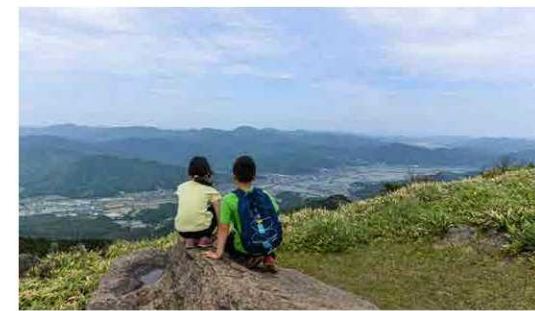
銅塚の山頂から与謝野町を眺める 兄妹

この登山は、福知山市・宮津市・与謝野町内の計5カ所の登山口から千丈ヶ嶽（832m）をめざすもので、コロナ前から人気のある行事です。与謝野町内の登山口の一つ「池ヶ成公園」からは約20人が登山。新緑の中、約3.5kmの山道をそれぞれのペースで一步一步踏みしめながら登り、頂上からの景色を背景に撮影する姿が見られました。参加者からは「再開を楽しみにしていました。がんばって千丈ヶ嶽をめざしたい」と話してくれました。