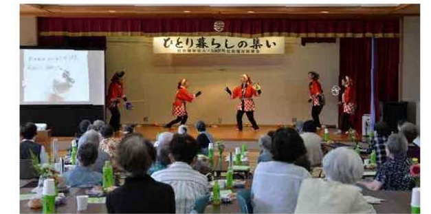
大道芸サークル白帆会の芸に見入る参加者

6/17 社会福祉協議会主催の「一人暮らしの集い」が岩滝ふれあいセンターで4年ぶりに開催され、町内各地域から約70人の方が参加しました。