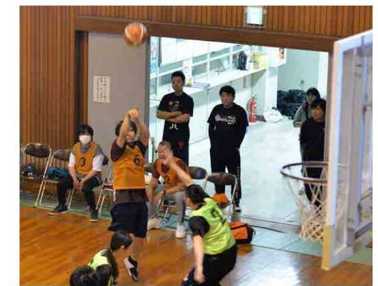
上/素早いパス回しをする石川区チーム 下/シュートを放つ与謝野町チーム