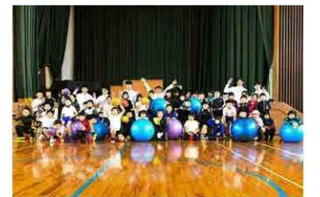
上/年長児を対象に開催した人形劇 下/高校・小学校とのスポーツ交流