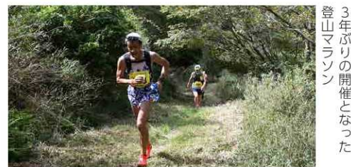
3年ぶりの開催となった登山マラソン