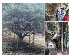
「滝のつばき」の樹勢回復事業

(3) 歴史的建物や史跡など文化財を整備活用し、地域の歴史文化を学ぶ機会を提供します。