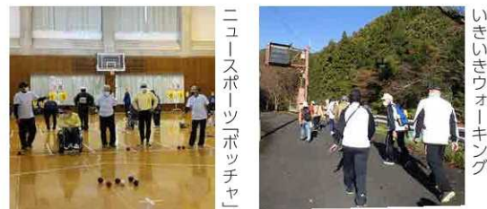
ニュースポーツ「ボッチャ」

(1) 町民一人ひとりが年齢や適性に応じて生涯に渡ってスポーツに親しめる環境整備に取り組み、健康で生き生きとした生活を送ることができる充実した生涯スポーツ社会の実現に努めます。