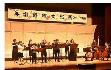
3年ぶりに開催した文化祭