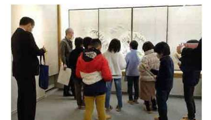
江山文庫を訪問する小学生たち