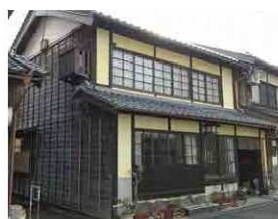
重要伝統的建造物群保存地区の修理・修景補助事業