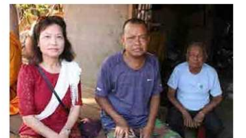
平和の大切さを学んだ人権講演会 (写真左が講師 ※ 講演会資料より)