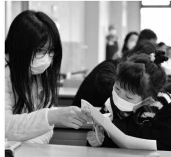
ストローを使ったおもちゃやポップアップ絵本をつくる親子(上・下)