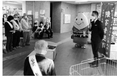
障害者週間啓発セレモニーの様子

毎年12月3日から9日までの1週間は、国民の間に広く障害者の福祉についての関心と理解を深めるとともに、障害者が社会、経済、文化その他あらゆる分野の活動に積極的に参加する意欲を高めることを目的として、「障害者週間」が設定されています。 この障害者週間を知ってもらうため、令和4年12月1日から9日までの間、加悦庁舎ロビーにて障害のある方が作られた作品等々を展示し、普段の活動などの紹介を行いました。また、同年12月6日には、同場所にて障害者週間啓発セレモニーとハートショップ販売会を実施。今後も、障害者週間を契機に「障害のある方への理解」が一層進み、障害のある方もない方もともに、安心していきいきと暮らす地域とするため、ご理解とご協力をお願いします。