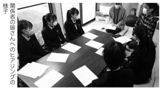
関係者の皆さんへのヒアリングの様子

り、アポイントメントを取ったり、打ち合わせに行ったりのすべてを生徒がこなしています。当然、提案が断られてしまうこともあり、すべてが順調に進むわけではありませんが、そういった経験すべてが学びとなります。 もちろん何か成果物が生まればよいですが、頭で考えたことを行動に移してみた、そういった経験をすることが何よりも大事だと考えます。 「社会のリアル」を感じてもらいたいことから、事前に教員から関係者に連絡はせず、生徒が直接連絡しています。突然の連絡かつ、言葉が足りないことも多く、先方には非常に多くのご迷惑