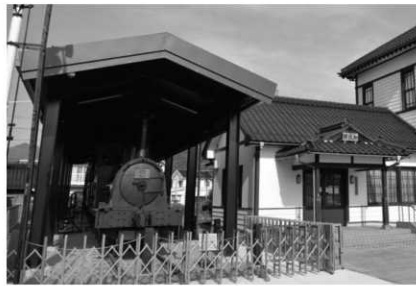
旧加悦鉄道車両を保護する覆屋