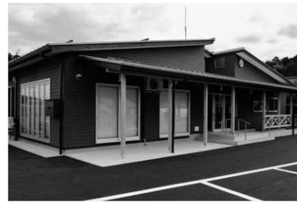
新築された温江地区公民館