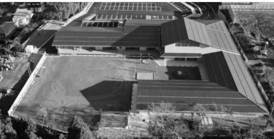
令和3年12月に開園した「つばきこども園」