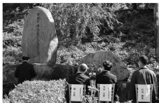
碑前に捧げる詞を読み上げる江原与謝野町日中友好協会理事長

京 都府日中友好協会主催による平和祈願祭が、10月16日に道の駅シルクのましかや内の慰霊碑周辺で開催されました。