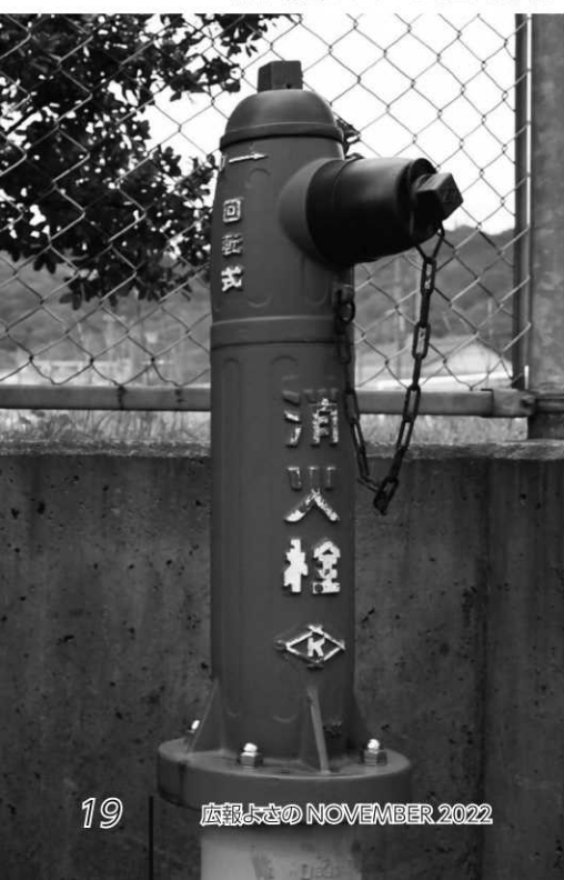
▼町内に設置されている地上式消火栓

ホースを2本使用する時は、1本目のホースのオス金具に2本目のホースのメス金具を結合します。また、人数が多い時は筒先担当者の補助や伝令（放水の合図の伝達）等で協力しましょう。