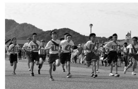
勢いよく飛び出す1区のランナー（小学生）

秋 晴れのもと、10月15日に阿蘇シーサイドパークで「阿蘇・天橋立小学生駅伝競争大会」が、峰山総合公園で「丹後ブロック中学校駅伝競争大会」が開催されました。