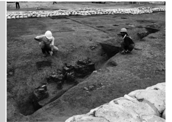
上/発見された環濠跡。内部から土器だ溜まりを3カ所確認。右/出土した土器類と石製品。約2,100年前のものと推測される。

また、令和2年度の調査では内側を巡るもう一つの環濠を発見しており、今回の環濠跡と併せて少なくとも環濠の一部が2重に張り巡らされていることが確認できました。日吉ヶ丘遺跡跡内の環濠集落の変容を知るうえで重要な発見となりました。