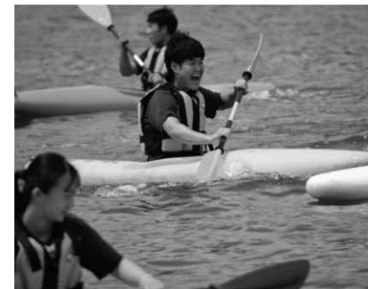
マリンスポーツチャレンジの様子

指導方針の元で指導されています。しかし、ただ身体を鍛えるだけではありません。特徴的な取り組みは主に3つ。①小学生スポーツ交流会、②長期休業中のスポーツチャレンジ、③普通救急救命講習の受講です。①は5年以上続く取り組みで、主に町内の小学生たちにトレーニング指導を行います。メニュー考案から当日の進行まですべて生徒が行います。小学生にとって高校生との交流は、非常に良い刺激となります。また、爽やかでテキパキと動く高校生の姿は、小学生に憧れを抱かせる分かりやすい存在となり、小学校の教員の方々にも非常に好評な取