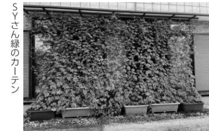
SYさん緑のカーテン

地球温暖化対策の一環として、町民の皆さんが取り組みやすく二酸化炭素削減効果の高い「緑のカーテン」の普及促進を図るため「よさの緑のカーテン