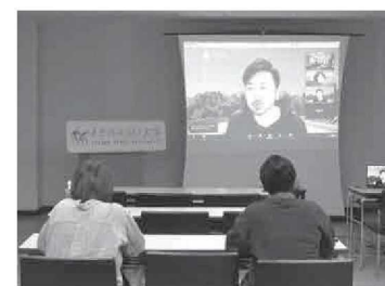
オンラインで開催された講座の様子

令和3年12月21日、オンラインでよさのみらい大学リベラルアーツコース講座が開催されました。