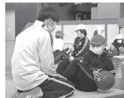
高校生と補強トレーニングに取り組む児童

キットトレーニングに挑戦。慣れないトレーニングに苦戦する児童もいましたが、高校生のおにいさん・おねえさんに教えてもらいながら、最後まで取り組んでいました。交流会の終わりに児童代表から「バランスボールを使ったトレーニングを家でもやってみよう」と感想を話し、児童らは高校生たちとの交流を楽しみました。