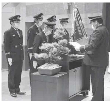
表彰を受ける団員