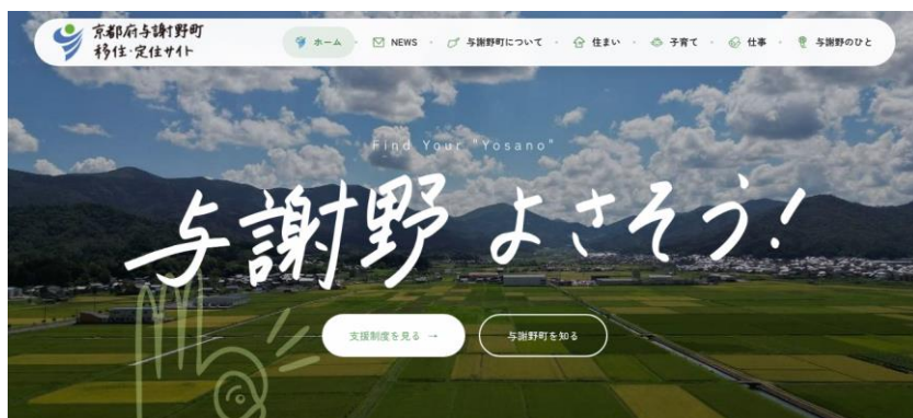
移住・定住サイトのトップ

URL : https://sangyoshinko.town.yosano.lg.jp/ijuteiju