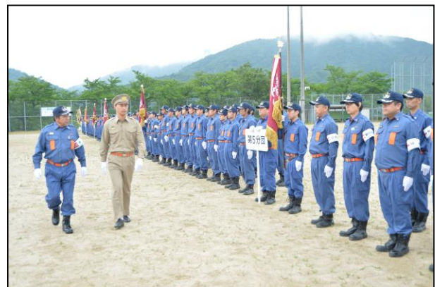
前回（令和元年）の町長査閲の様子

消防団員の職務遂行に必要な訓練や、その他諸般の状況を消防管理者である町長が点検するとともに、地域の皆様にその訓練の成果を披露し、団員の知識、技能の向上を図ることを目的に開催しています。