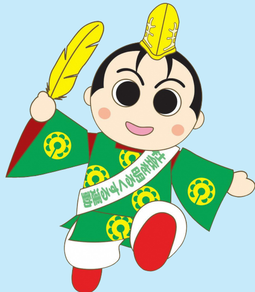
“社会を明るくする運動” 京都府推進委員会マスコットキャラクター京の社明くん