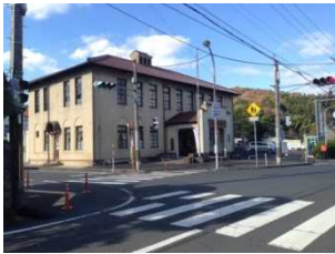
【現在の旧加悦町役場庁舎】