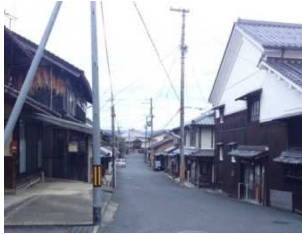
【現在のちりめん街道】