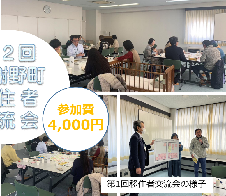
第1回移住者交流会の様子