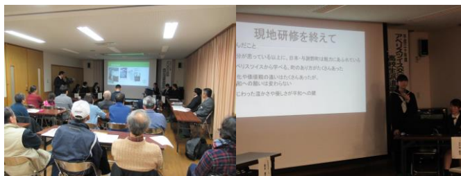
前回（平成30年度）報告会の様子

平成4年からは友好の架け橋として高校生の相互派遣交流を進め、受け入れと派遣を隔年で行ってきました（ここ3年間は、コロナ禍で相互派遣を中止）。これまでにアベリスツイスの高校生67人、当町の高校生83人（今年度含む）がお互いの町を訪問しています。