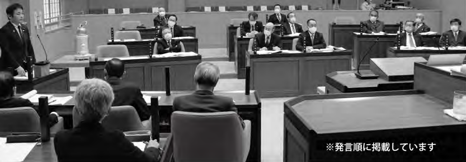
※発言順に掲載しています

「一般質問」は定例会のみ行われるもので、行政全般にわたる議員主導による質問であるが、質問を受ける執行機関も共に十分な準備が必要なため事前通告制となっています。「質疑」は提案された議案に対して疑義を問いただすことです。