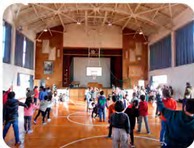
全校じゃんけん。勝った人だけ次に挑戦！