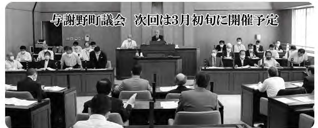
与謝野町議会 次回は3月初旬に開催予定

請願または陳情は、平日の午前8時30分から午後5時まで、加悦庁舎3階の議会事務局で受付しています。直接、議会事務局までお持ちください。