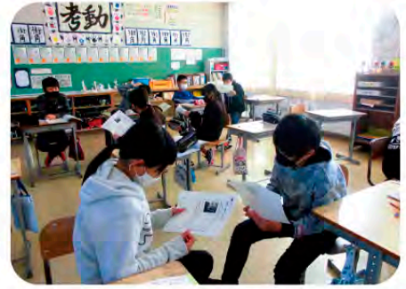
意見を交流し学び合い