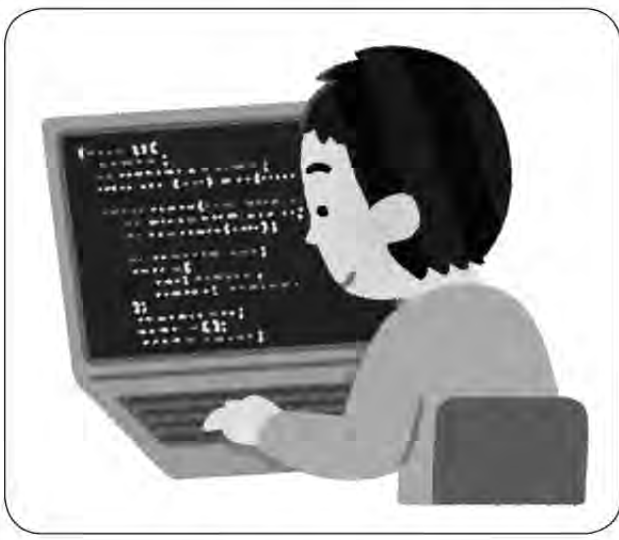
保守費用管理も大切