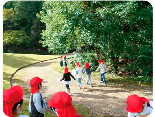
森林公園ヘレッツゴー