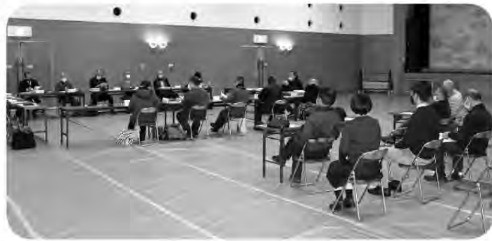
第6回目の委員会の様子

問 12月7日に行われた5回目の野田川地域の公共施設のあり方検討委員会に町長も出席し委員と対話をもったはずだが町長はどのような感想を持ったか。 町長 事前に提出されていた質問に答えた後、自由質疑を行った。委員の方々はこの質疑を材料に今後の委員会にて判断をされていくと考えている。 問 傍聴した委員会の中でスクラップ&ビルドの重要性を説明していたが、当町にはトライ&エラーの考え方も必要なのではないか。 町長 そのとらえ方はあくまで議員の考え方であり私の見解は差し控えたい。 問 委員会が出した答申はどの程度採