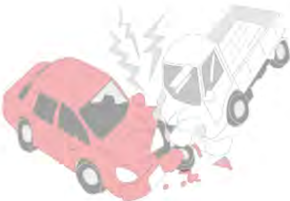
問われる事故の再発防止

令和2年10月15日午後2時頃、与謝野町石川の国道176号線において、与謝野町が保有する公用車が前方不注意により、ガソリンスタンドに進入するため減速した相手方車両に追突した。なお、相手方運転手に体の痛みが出ていることから、人身事故としても示談の協議を進めている最中である。事故の責任割合は、町が100%とし、相手方の損害額194万1千500円を支払うものである。