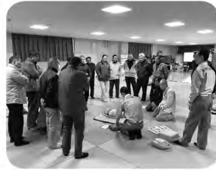
昨年度の防災訓練の様子

問 阿蘇シーサイドパーク周辺について 町長 阿蘇シーサイドパークの開発及び利用の考え方と計画の見直しは、物販など、スモールスタートとして進めていく。阿蘇シーサイドピクニックと題して、3密を避けることができる屋外空間での小さなフードイベントも開催されている。民間事業者と公園の賑わいづくりについて、検討を重ねる。 問 初期から計画がある海岸道路の延長計画の考え方は。 町長 交通上の問題がないため、事業化には至っていない。