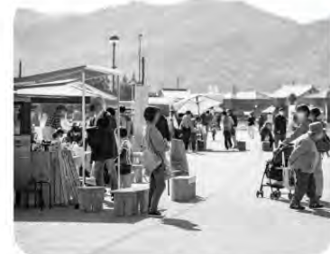
イベント開催中の阿蘇ベイエリア

なのか目指すものも見えない。理想だけでは観光は成立しないと感じている。 町長 指摘を踏まえ観光についての考えを深めていく。新年度予算にも精査し反映させていきたい。 産業振興も同様 問 産業振興も同じこと。実態を把握し、身の丈に合った政策が必要では。 町長 事業者に寄り添った施策が必要。多くの声に耳を傾け、現状把握をして再構築に努めたい。 問 総括として①将来像を明確化②経過説明や確認の徹底③効果が見える④理想論では無く現実論⑤町民の納得、観光にも産業振興にも見えること。 町長 もっともである。