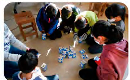
どこを押すとうまくいくかな 相談 相談