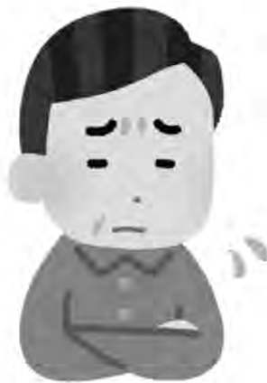
民間にも充実した支援を

問 コロナ対策として、野田川森林公園とリフレへの指定管理料追加931万円が計上されている。なぜ2施設だけなのか。 町長 内容は異なるが支援はする。産業振興会議等で、経済対策について議論する。 副町長 影響大の飲食と宿泊を行う施設とした。影響は民間も同じ。 問 コロナ対策として、野田川森林公園とリフレへの指定管理料追加931万円が計上されている。なぜ2施設だけなのか。 町長 内容は異なるが支援はする。産業振興会議等で、経済対策について議論する。 副町長 影響大の飲食と宿泊を行う施設とした。影響は民間も同じ。