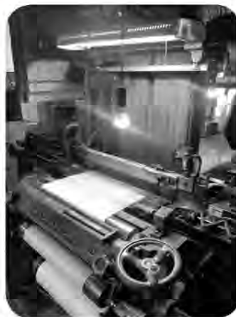
将来ビジョンを明確に

観光課長 昔に比べ施設そのものが縮小している。維持管理費は、従来より少額になっている。キャンプを楽しんでいただけの整備はしていく。