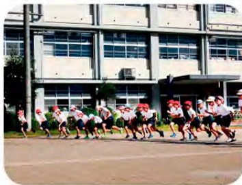
校内マラソン大会