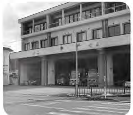
有事の際には迅速な対応を