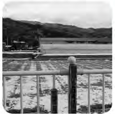
国道176号から見える農地

手確保・経営強化支援事業など、ソフト支援としては、新規就農者の就農前の研修を後押しする資金及び就農直後の経営確立を支援する資金交付がある。 問 農業振興地域整備計画の見直しは、国が示しているガイドラインでは、概ね5年ごとに調査を実施し、社会情勢の変化に対応するよう整備計画の見直しを行う。