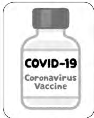
ワクチンの普及を早く

予防疫種の接種判断に 問 子宮頸がんワクチンの定期接種は、子宮頸がん全体の5〜6割の原因となるヒトパピローマウイルス感染症の予防効果がある。平成25年4月の定期接種化から2カ月で積極的な接種勧奨が控えられることになった。ワクチンの有効性や健康への影響等、正しい知識を得て接種対象の生徒や保護者が、接種の判断材料とするために、資料等で情報提供すべきだ。 町長 対象者にリーフレットと共に、情報提供の個別通知を送付した。