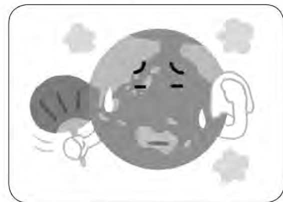
住み続けられる環境づくりを