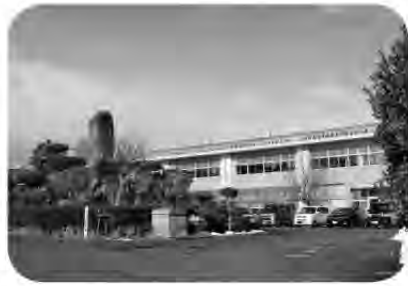
安全対策は厳重に