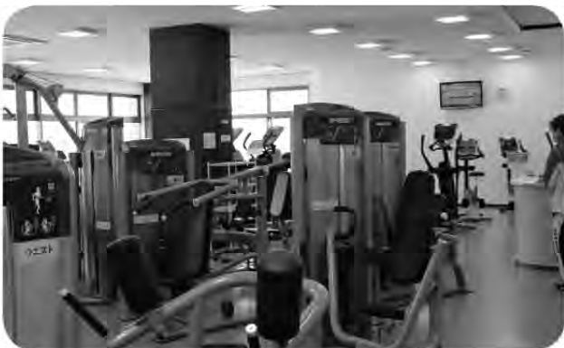
クアハウストレーニングルーム

問 デジタル・オンライン化 町長 国の政策であるデジタル・オンライン化に対応できる企業はあるのか。 町長 国府の支援がない想定での、農業の活性化を図っていくには、2次産業、3次産業との連携が不可欠と考える。