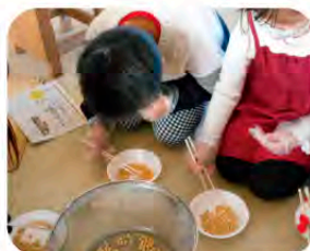
お手本の人をよく見てね

6年生の思いを5年生が引き継ぎ、石川小学校の新しい伝統を作る力に変えてほしいと思ひます。