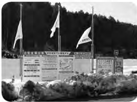
工事中の府道2号線

車は岩屋バイパスへ導き、地域住民の生活の安心、安全が確保できるように京都府に働きかけるべきだ。 町長 現在進めている岩屋峠改良区間の終点を町道岩屋川線まで延伸して岩屋川線を現府道のバイパスとし、府道に格上げしてはどうかとのことだが、岩屋、幾地区の通行車両を分散することは、結果住民の安心、安全に効果はあると思う。しかし、いまは岩屋峠の完成を府に目指していただき、岩屋川線は町道として管理しながら将来時期を見て協議したいが、道のりは険しい。