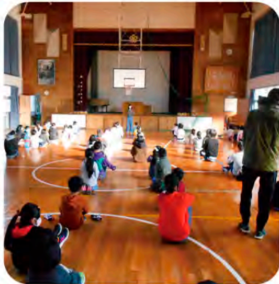
「石リンピック」の始まりです