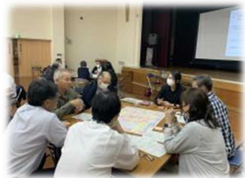
楽しい地域づくり