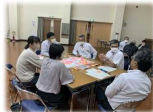
持続可能な地域活動