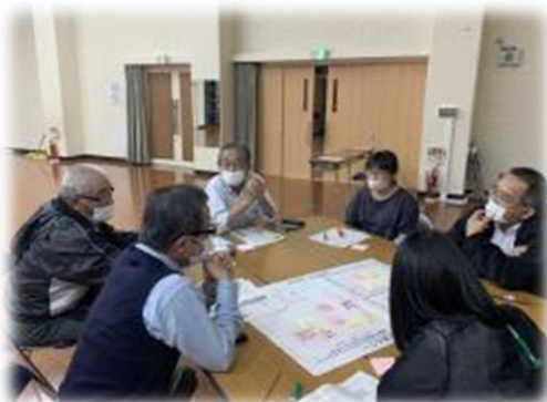
若者や女性の活躍