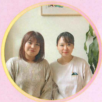
相談員（社会福祉士）