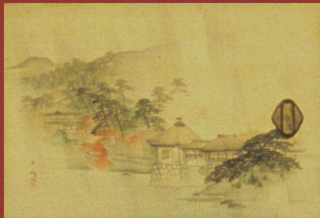
長谷川玉峰「四季京名所図」(部分)

与謝野晶子書いた京都にまつわる童話の 紹介とギャラリートーク (学芸員の展示解説) を行います。(14:00~15:30)