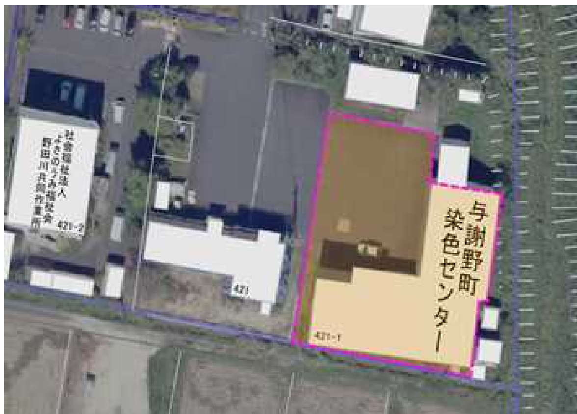
美化活動実施範囲