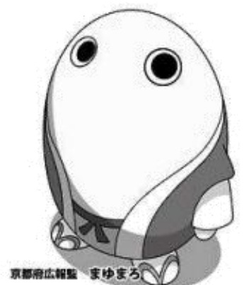
京都府広報 まゆまろ

家庭・青少年支援課 ひとり親・ヤングケアラー支援係 TEL 075-414-4585