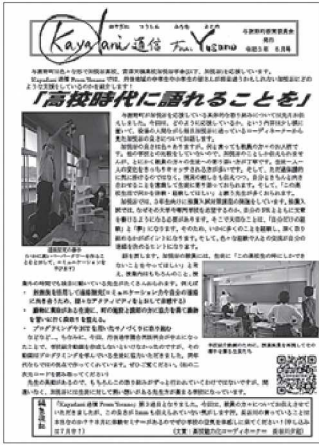
発行している通信

情報発信をしても、結局通っている生徒のリアルな声には敵わないのですが、それでも、大人目線の私が見た学校の良さをいいと思ってくれる子どもや保護者の方々がいて信じて引き続き発信していきます。「どんなことを発信しているの?」と気になる方がおられましたら、ぜひ、教育委員会社会教育課までお問い合わせください!