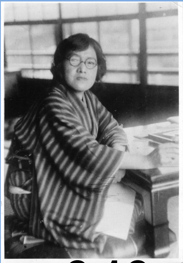
与謝野晶子近影 昭和五年五月 天橋立にて