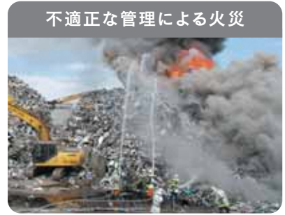
不適正な管理による火災

廃家電は電池やプラスチックを含むため、発火・延焼の危険性があり、不適正な管理による火災が発生しています。