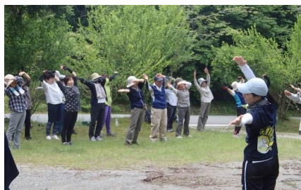
体力・健康増進を目的とした 「与謝野ひまわり体操」