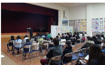
身近で大切な人権 （人権優秀作品表彰式）