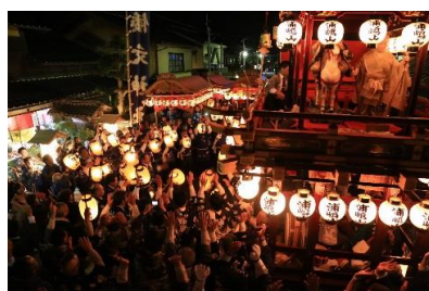
三河内の曳山行事