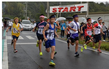
与謝野町 駅伝競走大会