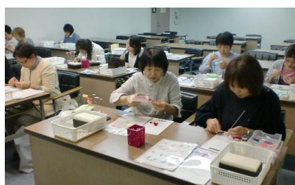
多彩な公民館活動