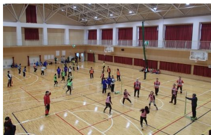
ニュースポーツの普及目的とした ニュースポーツ大会