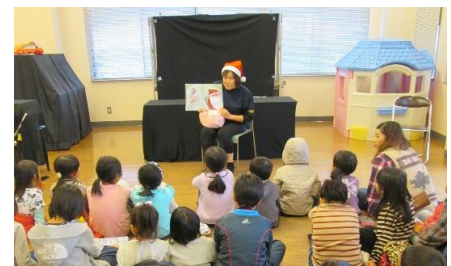
楽しい絵本の読み聞かせ