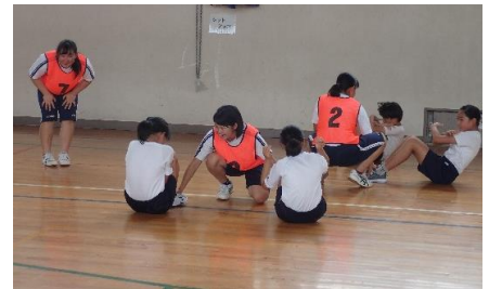
加悦谷高校とも連携して事業を実施（高校生による小学生のスポーツ指導）