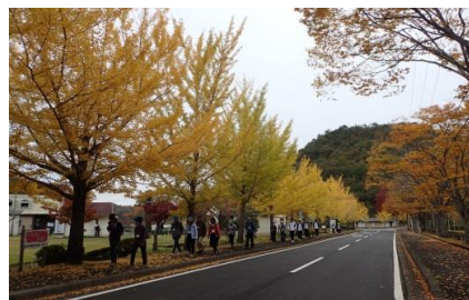
健康増進を目的とした ウォーキングイベント