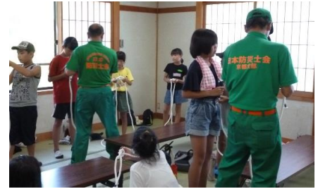
子ども達に様々な体験を（防災キャンプ）