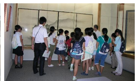
俳句と短歌の資料館「江山文庫」