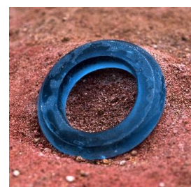
大風呂南1号墓出土品