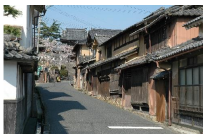
与謝野町加悦伝統的建造物群保存地区