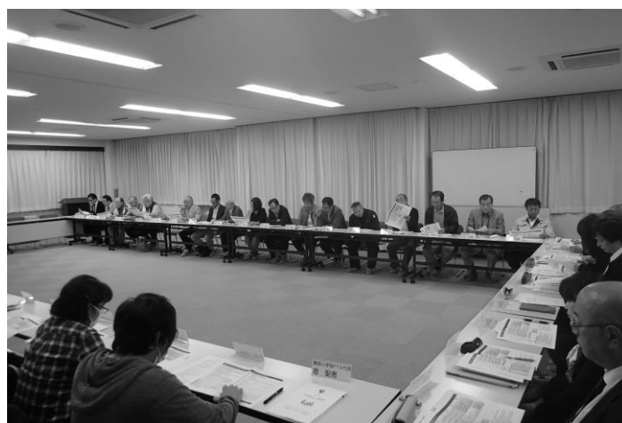
45名による第1回協議会の様子