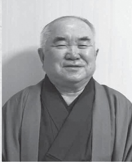
与謝野町議会議長