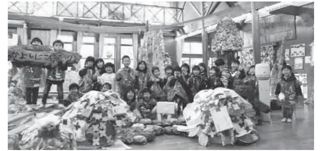
ホールいっぱい作られた「なかよし にこにこ もり」での記念写真