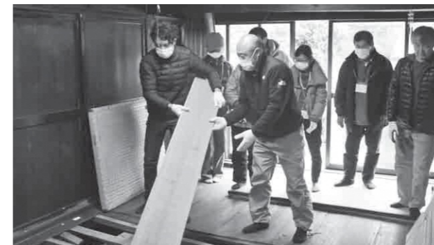
12月10日講座、講義後に受講者全員で協力しながら改修に向けた準備

よさのみらい大学では、3月まで地域や人の可能性を広げる面白い講座が目白押しです。これまでの講座や今後の講座については、よさのみらい大学ホームページにて案内し、随時受講申し込みを受け付けています。