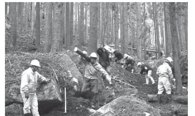
古道復興に向け倒木などを整備しました