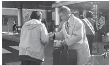
啓発物品を用い人権の大切さを伝えました

国際連合は1948年(昭和23年)12月10日に世界における自由、正義および平和の基礎である基本的人権を確保するため、全ての人民と全ての国とが達成すべき共通の基準として、世界人権宣言を採択し、1950年(昭和25年)12月10日を「人権デー」と決めました。日本ではこの日を記念して毎年12月4日から10日までを「人権週間」と定め、期間中、各関係機関や団体と協力し合い、人権尊重思想の普及と高揚を図るため、さまざまな活動を行っています。与謝野町では12月7日に京都府立医科大学附属北部医療センターにおいて、さまざまな団体の皆さんと人権街頭啓発を行いました。この人権週間や人権の大切さを広く地域の方々に知っていただくため、人権相談窓口の電話番号入りトートバックなどの啓発物品を手渡し、人権の尊重を呼びかけました。