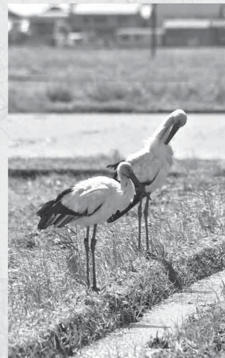
町内に飛来したコウノトリ*

は、皆さまのご理解とご協力をいただきながら、着実に前進させることができました。有機物供給施設増強整備工事や織物業生産基盤支援事業、各種産業振興施策等の実施により各事業者の皆さまの挑戦を支える基盤を構築するとともに、ビール醸造を見据えたホップ栽培事業やシルクプロジェクト等の未来を展望する各種施策を展開してきました。本町で育つ子どもたちの教育環境整備に関しても、加悦中学校全面改築やかえりこども園の新設をはじめとする各事業を完了するとともに、加悦・野田川地域のこども園の新設等についても、将来の見通しを示すことができたと考えております。