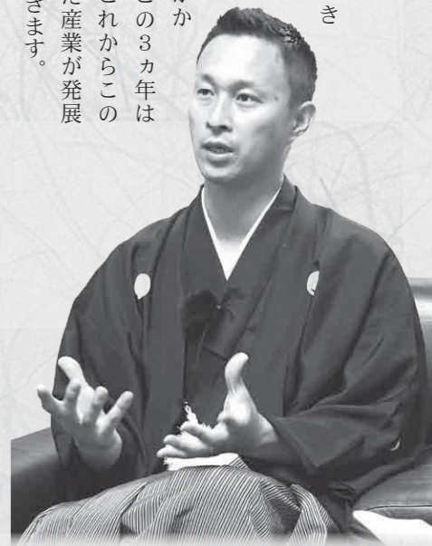
※本記事は、与謝野町有線テレビの番組「町長・議長の年頭あいさつ」をもとに編集しています。