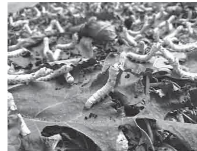
12月21日時点の蚕の様子

12月5日から全齢人工飼料育蚕研究室(与謝野町染色センター敷地内)において、与謝野町商工会と丹後織物工業組合で構成する「与謝野シルクプロジェクト推進協議会」による試験養蚕が始まりました。 シルクプロジェクト事業は、国外に依存している桑栽培から養蚕、商流に乗せるまでを一貫して行い、高品質なテキスタイル製織はもとより、食品や医療分野など他領域においてもシルクを用いたビジネスモデルを構築し、桑・シルクを軸にした『しごと創出』を目的として取り組まれています。協議会では、5月に植樹した桑を10月に刈り取り、冬季の養蚕の可能性を含めて検証するために試験養蚕を行うっており、繭を取るところまで行うこととされています。