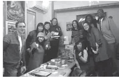
日本で初めての誕生日 今は誕生日は大好きです！（左から5番目が筆者）

1月は私の誕生月でもあり、今月で27歳になります。アメリカでは、子どもたちは誕生日にクラスメイトをたくさん招いて誕生日パーティーを開くのが一般的です。しかし、私は子どものころ大変な恥ずかしがり屋だったため、誕生日が苦手でした。誕生日パーティーで友達は私のために「Happyバースデー」を歌ってくれましたが、机の下に隠れたくなるほど恥ずかしかったことを覚えています。私は自分の誕生日が苦手でしたが、私の母はパーティーを企画するのが好きだったので、いつも私の誕生日にはさまざまな工夫を凝らした誕生日パーティーを開催してくれました。母が企画した誕生日パーティーで思い出深いものにはこんなものがあります。ある私の誕生日、日中は食事やゲームを楽しみ、夜になると裏庭でイベントを開催しまし