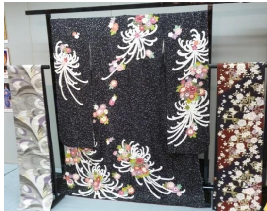
(丹後ちりめんの着物)