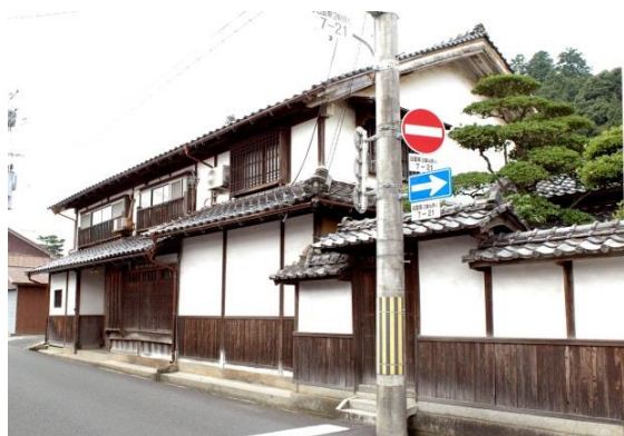
34 下村五郎助家住宅