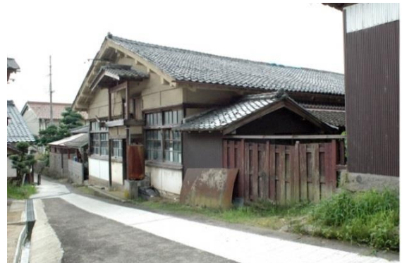
(西山機業場の織物工場)