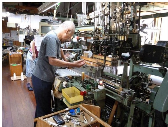
(丹後ちりめんの製織作業の様子)