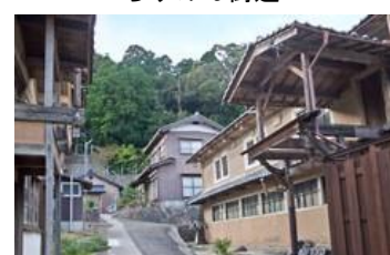
西山工場(丹後最古のちりめん工場)