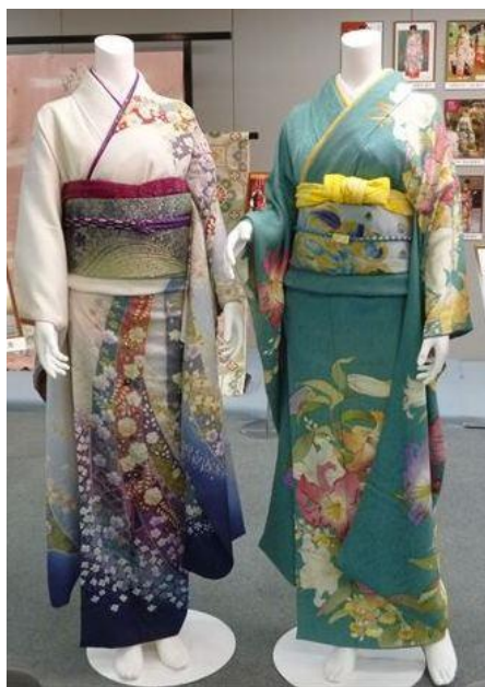
(丹後ちりめんの着物)