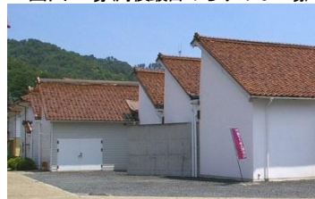
丹後ちりめん歴史館