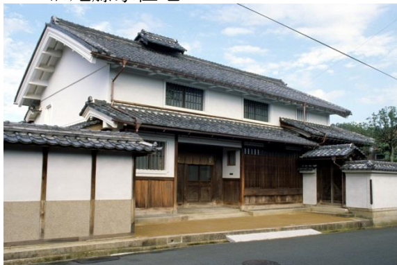
31 西山機業場の建物群