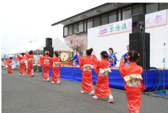
(丹後ちりめん小唄)