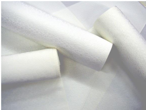
(丹後ちりめんの反物)