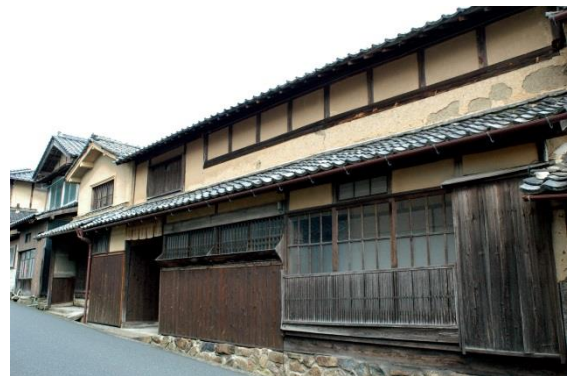
33 下村与七郎家住宅