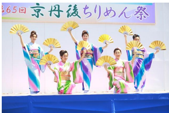
(京丹後ちりめん祭)