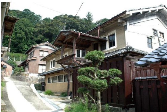
(西山機業場の織物工場)