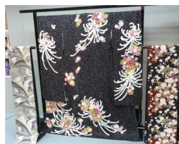
丹後ちりめんの着物