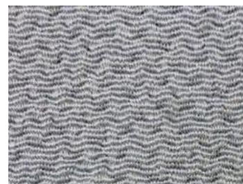
丹後ちりめんの「シボ」