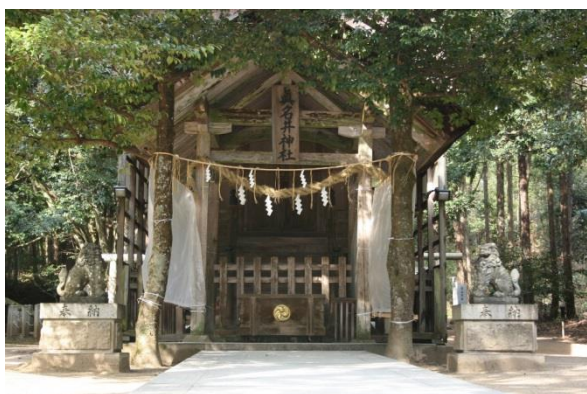
25 籠神社奥宮 真名井神社