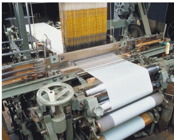
(丹後ちりめんの織機)