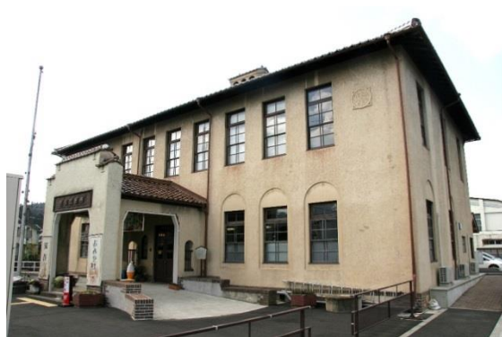
36 旧加悦町役場庁舎