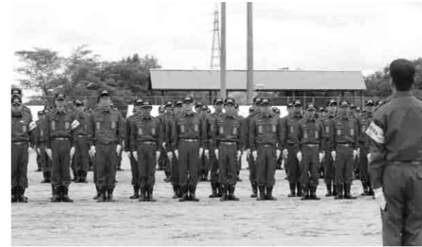
各分団規律・活力のある訓練を披露しました