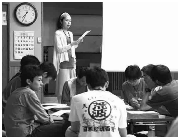
京都Xキャンプの皆さんと検討会

人が優しくとてもあたたかいです。また、空気がとても新鮮であり、自然が豊かで特に山の色合いがとても綺麗だと感じました。与謝野から町を一望できる絶景に感動したことが非常に印象に残っています。