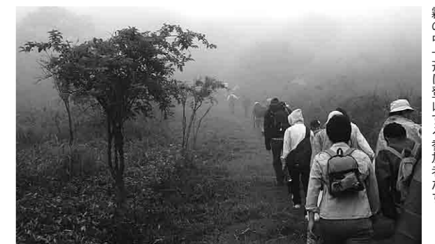
霧の中一斉に登山する参加者たち