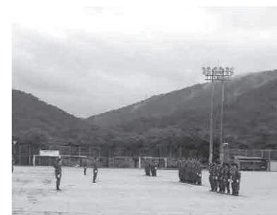
上/隊長の指示を聞き、各個訓練を披露するひまわりふれ愛(手前の隊) 右/隊長に対して敬礼