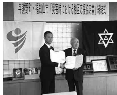
松山福知山市市長と握手をかわす山添町長

大江山連峰を境として隣接する市町として、被災時に災害応急対応を迅速に実施できる防災上の大きな利点になる