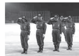
町長査閲に向けて一生懸命な訓練