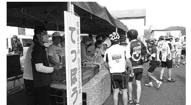
エイドステーションでは「てっぽう」がふるまわれる

サイクリストたちは、各地域の特産品、景色を楽しみながらゴールまで駆け抜けました。