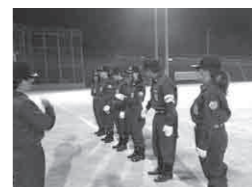
本部の方にもアドバイスもらいながら訓練