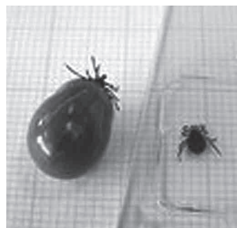
体長は数 mm ですが、動物や人間の血を吸うと 1 cm ~ 2 cm になるものもあります

マダニがウイルスや細菌などを保有している場合、かまれた人は病気を発症することがあります。マダニが媒介