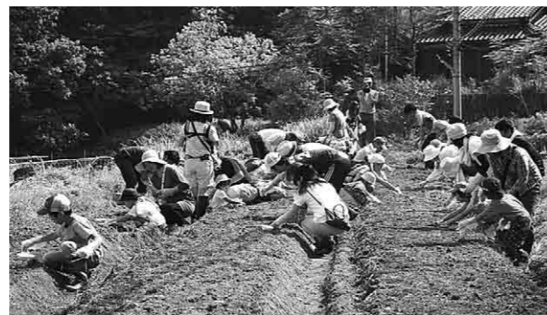
ていねいに種を植える参加者の皆さん

与謝野町ひまわりフェスティバルは8月上旬ごろ（ひまわりの開花状況によっては前後する可能性があります）行われます。ほ場をいっぱいに使ったひまわりによる巨大迷路、切り花、フォトコンテスト（Facebookに写真を投稿して「いいね」の数を集めよう）、ヨガとお風呂体験等楽しい催しが盛りだくさんとなっています。