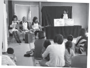
大型絵本を読むマザーグースの会