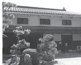
虫籠窓がある厨子二階の建物

「ちりめん街道」の建物群を例に、古民家の特徴の一つである厨子二階と虫籠窓について紹介します。ちりめん街道には、18棟を超える厨子二階の建物があります。厨子二階とは、一階の天井が二階の床と兼ねる建物の二階部分のことです。平屋建てよりも、空間を有効に使うために造られました。ちりめん街道のものは、すべて江戸く大正期に建てられており、この様式は、建築年代が古いことも分かれます。