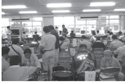
いただいたベンチに座り記念撮影

延べ31名派遣 災害廃棄物処理 8月23日 2名派遣 (※2トンプ車両を含む) 農地被害調査 8月27日～8月29日 延べ5名派遣 延べ38名を派遣 ■その他 町社協の被災地ボランティア派遣の支援(運行バス借り上げ支援)