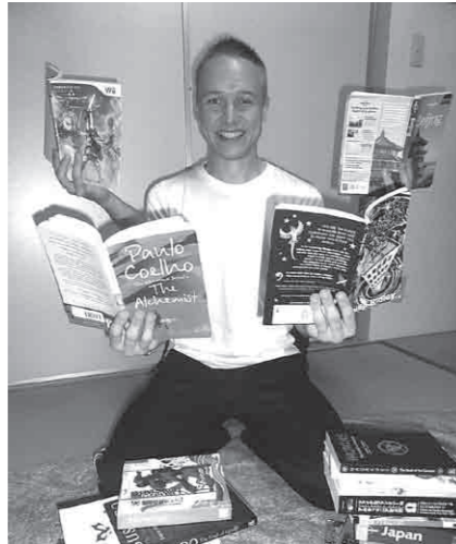
読書が大好きです！

私が子どものとき、姉と一緒に「メルセデス・アイス」という小説を何回も読みました。この本のあらすじは、退屈で、色彩のない高層建築に住んでいる少年（メルセデス・アイス）がクモの巣で織られたマントを纏った少女と出会い、色を探すために一緒に冒険するというものです。この本は、自分で上手に読むことができるようになる前は姉がよく読んでくれたので、とても良い思い出です。イギリスでもあまり有名な本ではないですが、私はとても大切にしています。今回、15年ぶりにこの