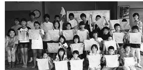
草木染を行いオリジナルのハンカチを作りました

8月は天候不順で、企画したイベントが中止になるなど予定どおりいかなかったこともありましたが、地域の方からは「若い学生が居て、屋台カフェなどで交流会があり地域を元気にしてくれた。また来年も」といった声が聞かれました。