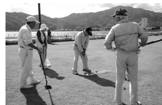
終始盛り上がりを見せたグラウンド・ゴルフ大会

今後も定例会として、開催されていく予定です。詳しくは、阿蘇シーサイドパーク公園管理センターまたは、建設課（☎46-3267）までお問い合わせください。