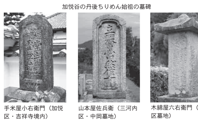
加悦谷の丹後ちりめん始祖の墓碑 手米屋小右衛門(加悦区・吉祥寺境内) 山本屋佐兵衛(三河内区・中岡墓地) 木綿屋六右衛門(後野区墓地)

丹後ちりめん始祖伝 丹後ちりめんは、江戸時代中頃の享保年間、戸幕代中頃の享保年間、徳川幕府8代將軍吉宗の時代とされています。ちりめん織りの技術は、丹後で発明されたものでなく、丹後出身の先人が京都西陣で技術を習得して当地に広めたと言われている。 丹後ちりめん始祖とされる人物は、峰山藩では峰山の綱屋佐平治、宮津藩では後野の木綿屋六右衛門、三河内(山本屋)の山本屋佐兵衛、加悦の手米屋小右衛門の4人と言われています。 まず、享保5年(1720)に絹屋佐平治がちりめん織りに成功し、続いて、享保7年(1722)に山本屋佐兵衛ら