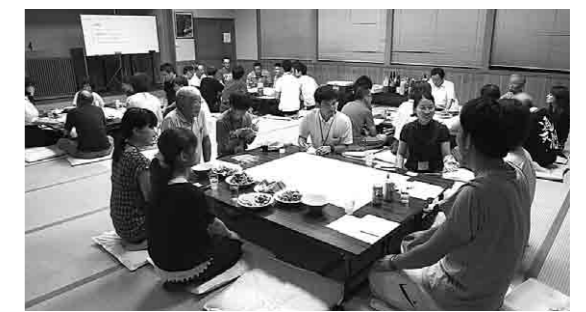
地域住民とのふれあいを行うXキャンプの皆さん

※京都Xキャンプは、農村地域などの活性化を図るため、大学生が夏休みを利用して与謝野町滝・金屋地区を中心に学生ならではの視点からアイデアを出し合いさまざまな活動を行う取り組みであり今年が3年目の取り組みです。