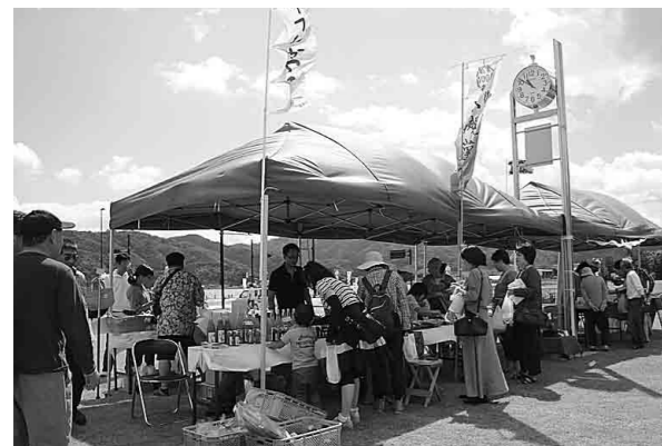
与謝野町の特産品が並び、多くの人々が訪れました