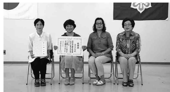
受賞後の記念撮影