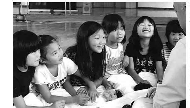
職員の話聞き入る石川小の児童たち