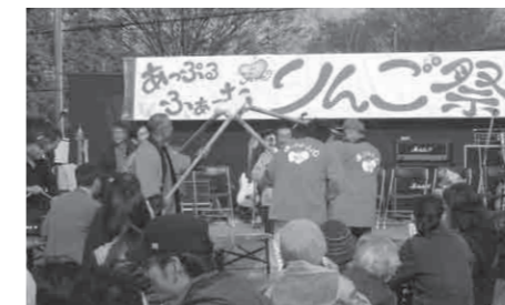
以前行われたりんご祭の様子