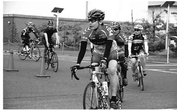
エイドステーションから出発する選手の皆さん

サイクリストたちは、各地域の特産品、景色を楽しみながらゴールまで駆け抜けました。