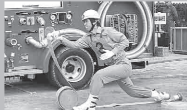
野田川第4分団ポンプ車操法