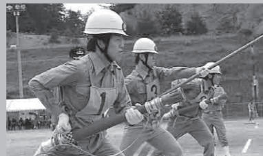
加悦第1分団ポンプ車操法