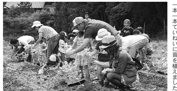
一本一本丁寧に苗を植えました

また、自分の植えたひまわりが分かるよう、名前の書いたプレートを作り、目印を付けました。子どもたちは、ひまわりの成長を楽しみにし、ひまわりフェスティバルが待ち遠しい様子でした。