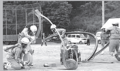
野田川第3分団小型ポンプ操法