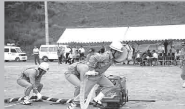
加悦第2分団小型ポンプ操法