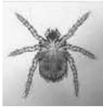
ツツガムシの拡大写真

「マダニ」は、固い外皮に覆われた比較的大型(吸血前で3〜4mm)のダニで、主に森林や草地などの屋外に生息しており、市街地周辺でも見られます。肉眼では気づきにくいことが多いです。食品等に発生する「コナダニ」や衣類や寝具に発生する「ヒョウダニ」などの家庭内に生息するダニとは種類が異なります。 「ツツガムシ」は、野外にいるダニで、親虫、若虫は地中で昆虫の卵などを食べて生活していますが、幼虫の時期に地表へ出て一度だけ野ネズミなどに吸