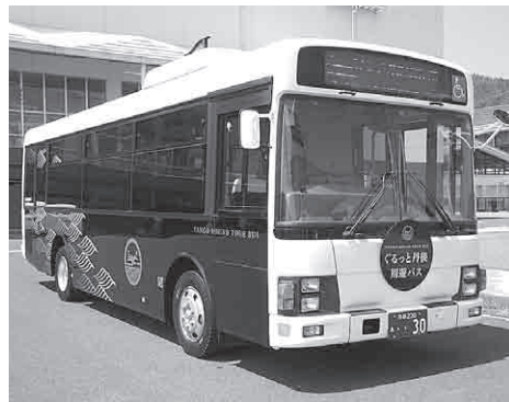
7月19日から運行が開始されるぐるっと丹後周遊バス (愛称:ぐるたんバス)