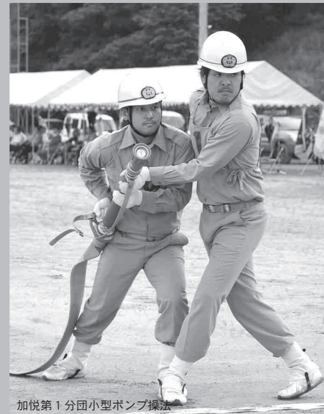
加悦第1分団小型ポンプ操法