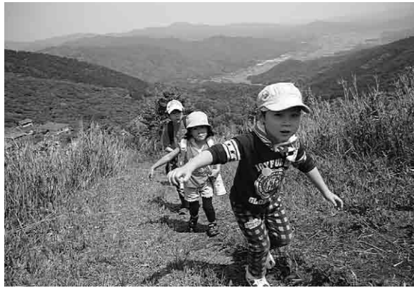
山頂を目指し、楽しく登る子どもたち