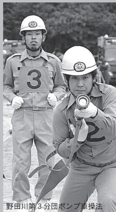
野田川第3分団ポンプ車操法