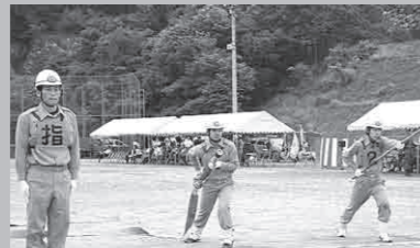
野田川第4分団小型ポンプ操法