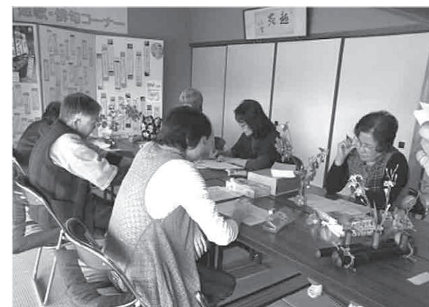
未経験者の方でも楽しめる句会となっています。