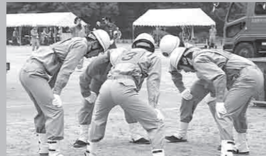
加悦第2分団ポンプ車操法