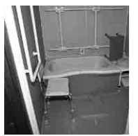
バリアフリー化も減額の対象です

固定資産税を減額する制度があります。 住宅の省エネ改修工事をはじめ、要介護者のためのバリアフリー化、および耐震改修工事を実施した場合、工事が完了した年の翌年度以降、一定期間に限り固定資産税を減額する制度があります。 減額制度の適用を受けるためには、いずれの場合も「改修工事後3カ月以内」に申告書を提出していただく必要があります。制度の概要は次のとおりです。 詳しくは税務課までお問い合わせください。