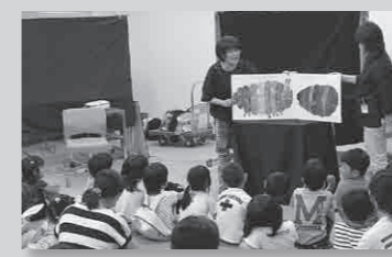
大型絵本をよむ「おはなし倶楽部よむよむ」のおはなしを熱心に聞く子どもたち

6月7日（土）、知遊館で、与謝野町で読み聞かせ活動を行っているボランティアグループ（加悦読み聞かせ会、カナリア会、おはなし倶楽部よむよむ、マザーグースの会、：プログラム順）が集まって、読み聞かせやペーパーサート、エプロンシアターなど日頃の活動を披露していただきました。参加者は48人で、各グループの持ち味を生かしたおはなしの世界を楽しみました。