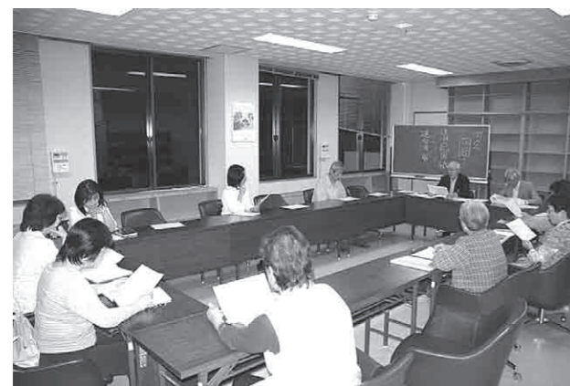
左・右／熱心に講師の話聞き、俳句づくりに取り組む参加者たち。また、交流も深まります。