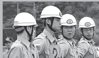
野田川第2分団ポンプ車操法