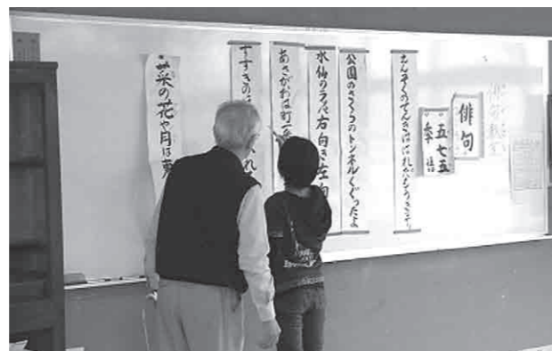
俳句を通しての世代を超えた交流