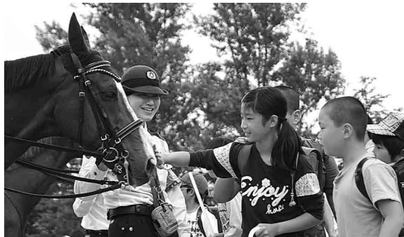
大きな馬に興味津々の児童