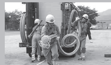
岩滝第3・4分団ポンプ車操法