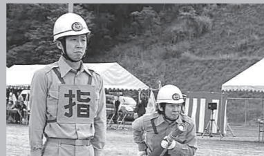
加悦第3分団小型ポンプ操法