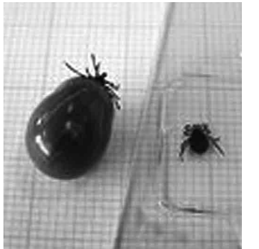
吸血前(右)と吸血後(左)のダニを比較

●長時間地面に直接寝転んだり、座ったりするのは止めましょう。 ●服などにダニが付着している場合があるので、車に乗る前、家に入る前には服をはたきまじょう。着いた服はすぐに洗濯するか、屋外で天日干ししましょう。