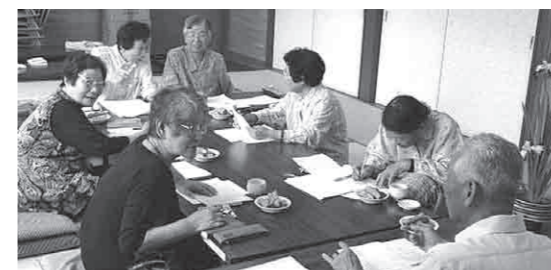
みんなで楽しく俳句作りを行います。