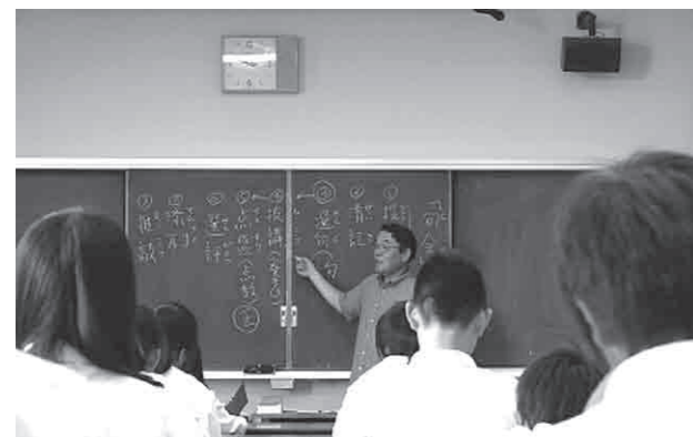
講師から俳句を学ぶ生徒たち