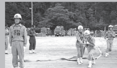
加悦第3分団ポンプ車操法