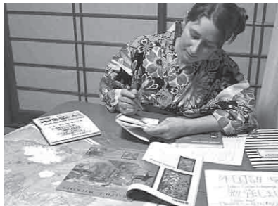
私も毎日日本語を勉強しています。皆さんも外国語を勉強してみませんか？

母のアドバイスのおかげで私はタバコを吸わず、三つの外国語（スペイン語、日本語、フランス語）を勉強することができました。たくさんのすばらしい人と出会い、すばらしい経験ができました。お母さん本当にありがとう！