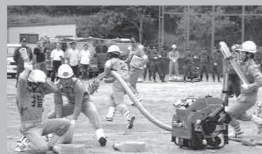
野田川第1分団小型ポンプ操法