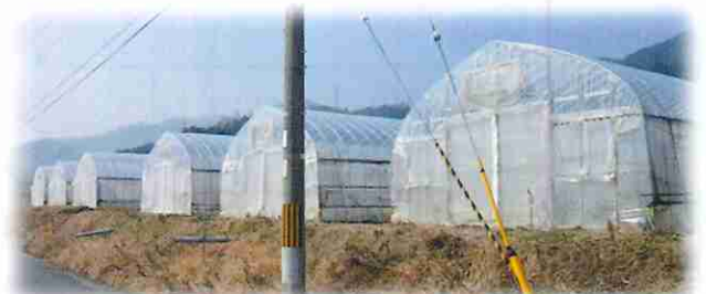
▲金屋地区に6棟ものハウスが並ぶ。現在はネギ・水菜を中心に栽培。