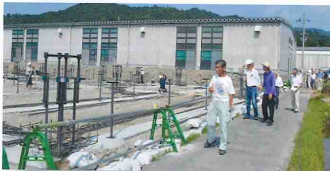
▲農地パトロールを行っている様子

農業委員会では、年に一回、農地法3条、4条、5条、形状変更の許可・承認がされた案件の現地に行き計画通り進捗・完了（3条は耕作）しているか状況を確認する農地パトロールを行っています。申請通りに工事等が行われていない場合、指導を行っています。農業委員会では、違反転用や悪質な利用がされないように農地パトロールを続けていきますので、皆様のご協力をよろしくお願い致します。