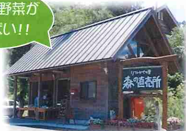
▲森の直売所はリフレかやの里の前の駐車場にあります。