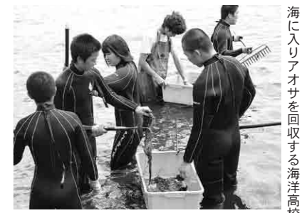
海に入りアオサを回収する海洋高校の生徒たち（上）と区民ら（下）

さらに橋立中学校の生徒たちおよそ100人が、アオサをトラックに積み込む作業を手伝った後、微生物の力で水質を浄化する水質浄化剤「バイオコロニー」を海にまきました。アオサの一部を学校の畑