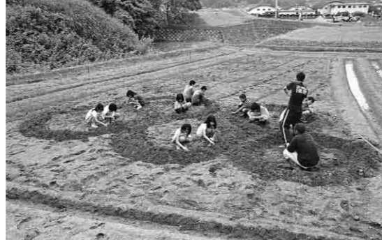
五輪をかたどり、種をまきました

朝、昼、夜の部、それぞれの部に分かれて行われた講座には、延べ104人が参加。夏のイベントにはゆかたでかけようと、ゆかたや夏用着物の着付けと帯結びの方法を楽しく、熱心に学んでいました。