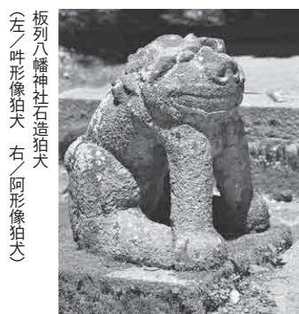
板列八幡神社石造狛犬 (左) 吽形狛犬、右) 阿形狛犬