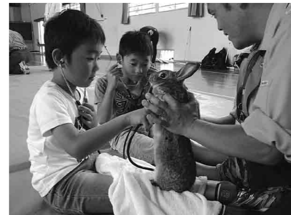
聴診器でウサギの心音を聴く児童たち

小さな動物ほど心音が早いことを学んで体験をした児童たち。「すごく早い！」と驚いた様子で、「ウサギがとてもかわかった」と笑顔を見せてくれました。