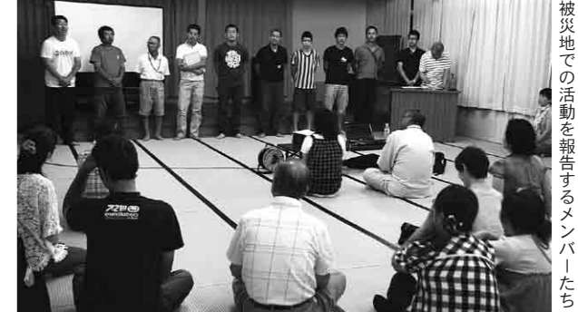
被災地での活動を報告するメンバーたち