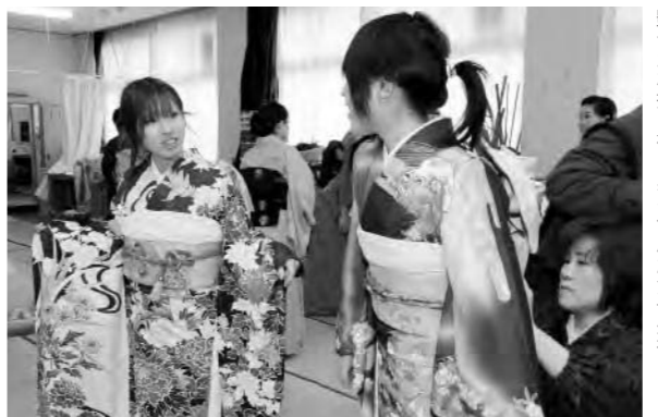
艶やかな振り袖に身を包んだ女子生徒

今年で20回目を数える恒例の行事で、これまでに「浴衣」「袴着物」の着付け教室が行われています。教室の最終回となった今回は、着付けの先生やそのお弟子さんらに指導を受けながら、女子生徒が「振り袖」、男子生徒が「羽織袴」の着心地を体験。着物に初めて袖を通したという女子生徒は「気持ちひびきまると笑顔で話していました。」