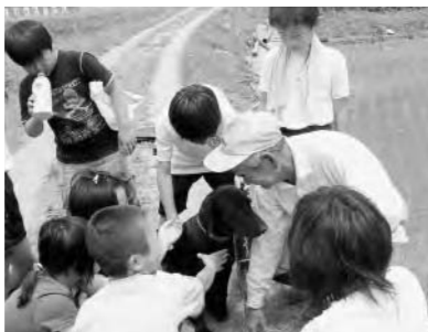
里守犬と交流する岩屋小の子どもたち