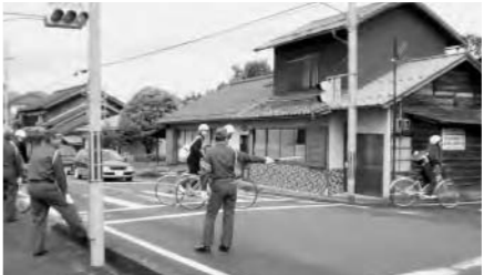
通学や通勤の時間に合わせ、立番を実施しています(写真は江陽中学校下の横断歩道)

昨年の交通事故発生件数は八十件でした。与謝野町交通安全対策委員会では交通安全思想の普及・啓発に努めていますが、昨年は町内において八十件の交通事故が発生しました。平成十九年と比較すると、町内で六件の減少とはなったものの、宮津与謝管内においては十五件の増加となっています。 委員会では引き続き交通事故防止活動に取り組みますが、町民の皆さんもより一層交通安全に努めていただきますようお願いいたします。