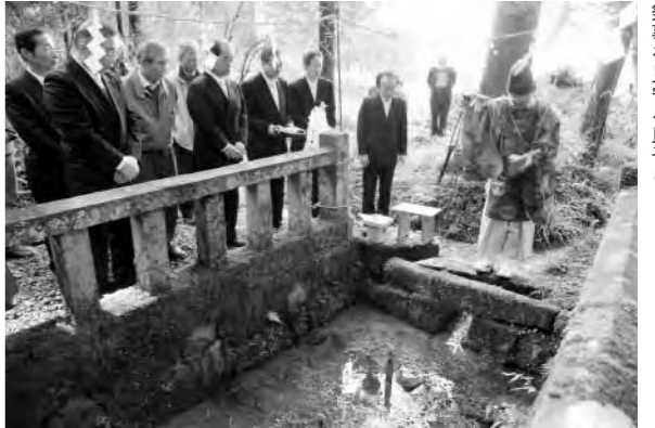
祭事を見守る氏子ら