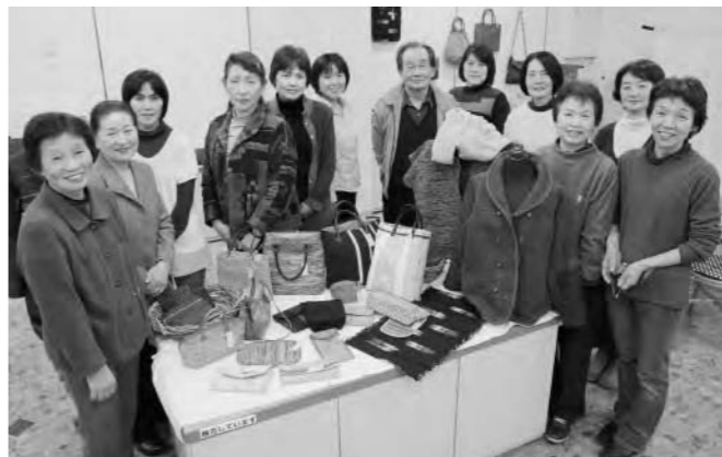
「ひまわりの未」のメンバーの皆さん。現在は20人で活動中。「第2・4日曜日が活動日です。気軽にセンターをのぞいてもらい、ぜひ手織りを体験しに来てください」

ンバーの中には、自宅に本格的な手織り機を購入した人がいるほど。メンバーの一人は「地場産業である織物の良さをあらためて知った」と言い、「みんなと和気あいあいとアドバイスをし合っ