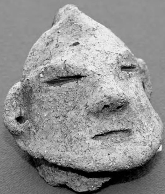
今回発見された「人面付き土器」