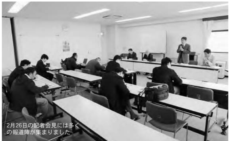
2月26日の記者会見には多くの報道陣が集まりました