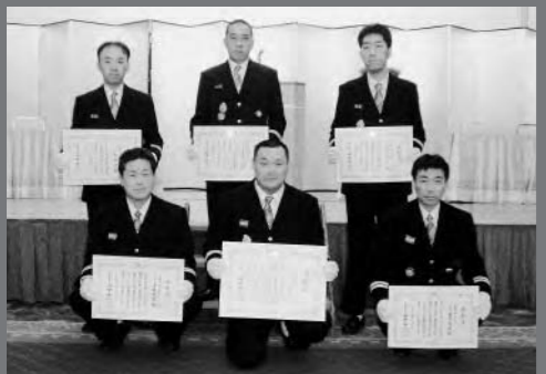
京都府知事表彰個人表彰受章の皆さん