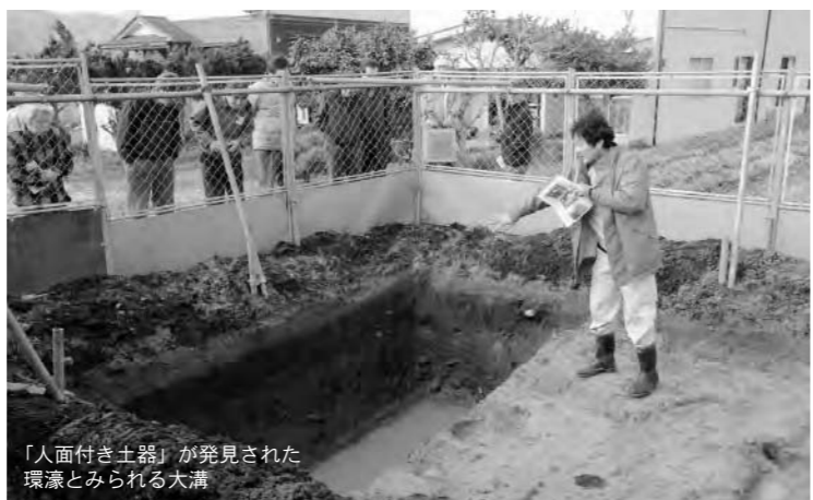
「人面付き土器」が発見された環濠とみられる大溝

昨年11月から行われていた「温江遺跡」の発掘調査結果がこのほど発表され、弥生時代前期には「環濠集落」が存在したことが確認され、さらに、弥生人の姿を写す貴重な「人面付き土器」が発見されました。