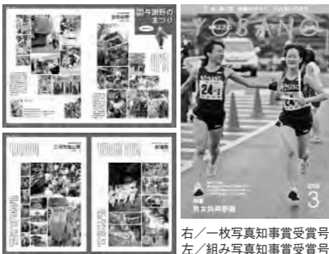
右/一枚写真知事賞受賞号 左/組み写真知事賞受賞号

府内の市町村の行政広報の発展向上を図ることを目的に毎年実施されている「平成二十年度京都広報賞」(京都府広報協議会主催)がこのほど発表され、五部門応募総数五十一の中から、『広報よさの』が一枚写真の部と組み写真の部で知事賞を、また広報紙の部(町村の部)で会長賞を受賞しました。 一枚写真の部で知事賞に選ばれたのは『広報よさの三月号』(No.25)の表紙。市町村対抗駅伝の第一中継所でのタスキリレーを撮影した写真は「選手の声が聞こえてきそう」との評価を受けました。 また、組み写真の部は『広報よさの五月号』(No.28)の「特集 与謝野のまつり」。各地区の祭の魅力に迫り、その熱気や興奮が伝わるように組んだ写真は、「すべてが生き生きと見える」との評価を受けました。 取材にご協力いただいた皆さん、そして読んでいただく皆さんに心から感謝します。今後も、皆さんに親しんでもらえるよう、与謝野町の今を伝え、がんばる人を応援する広報誌を制作していきます。