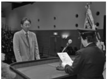
火災現場で初期消火に尽力された民間協力者に、町長から感謝状が贈られました

平成二十年与謝野町消防団出初式が一月六日、野田川わくばるで行われ、消防団各方面隊から二百二十人の団員が参加しました。 式典では、功労者や永年勤続者らに表彰状の伝達が行われ、退職消防団員と民間協力者に感謝状が贈呈されました。