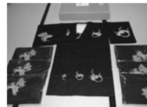
岩滝大神楽保存会祭用備品