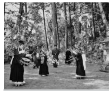
●文化財の種類/無形民俗文化財(町指定) ●管理者/大命神社笹ばやし保存会 ●時代/江戸時代

町内では、四月末から五月初めにかけて、各地区で太鼓や笛の音が響きわたり、祭一色になります。早いところでは、三月の初めから日夜祭りの練習に励まれることと思いますが、石川の高津地区を中心に大命神社の祭祀として行われる「笹ばやし」は、二月中旬頃から祭りの準備が始まります。石川区では、大命神社・物部神社・大宮神社・稲崎神社の四神社が一つの祭祀圏をつくっており、祭祀当日には、他地区の神楽、太刀振りの芸能とともに、物部神社・大宮神社で笹ばやしが奉納されています。笹ばやしは、中央にシンポチ(新発意)と呼ばれる役一人と、それを挟む両側に太鼓持ち二人の小学生三人が踊りを演じ、その後ろで大人(氏子)数人が音頭を取るかたちの芸能です。特徴はシンポチと太鼓持ちの衣装で、シンポチはヨロイと呼ぶ五色の紙