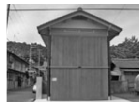
後野区下之町屋台蔵