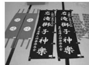
岩滝大神楽保存会祭用備品