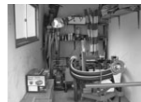
滝区消防隊防災備品

地域コミュニティ活動の発展を目的に、財団法人自治総合センターの自治宝くじ受託事業収入を財源とするコミュニティ助成金を受け、後野区下之町に屋台蔵、岩滝大神楽保存会(東町区)に祭用備品、滝区消防隊に自主防災組織用備品が整備されました。