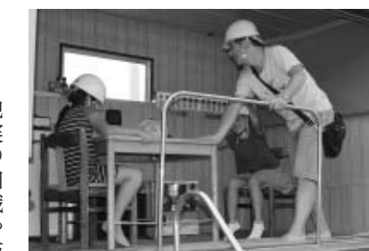
↑起震車による地震の模擬体験も行われました

地震の知識や防災対策と同時に、わが家の耐震についても関心を持ってもらおうと「地震について住まいるづくり推進フェア」が九月十五日、加悦谷ショッピングプラザウィルで開催されました。