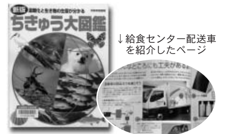
↓給食センター配送車を紹介したページ

地球環境と温暖化の現在がまるごと分かり、地球にやさしくなる図鑑です。人間が引き起した温暖化によって自然環境や生物はどんな影響を受けているのか。3500点を超す貴重な写真と図版で、地球が抱えている問題を教えてください。この図鑑には、廃食用油で走っている与謝野町給食センターの配送車も紹介されていますので、ぜひ一度ご覧ください。