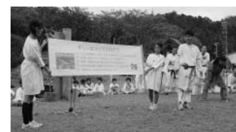
↑古代劇は、存亡の危機に面した3つの国が手を取り合い、難局を解決するというストーリーでした

「第十四回丹後王国古代まつり」が九月二十三日、古墳公園で開催されました。毎年大好評の古代劇では、加悦町商工会青年部と桑飼小学校五・六年生の児童が共演し、趣向を凝らしたステージで楽しませてくれました。他にも火起こしや勾玉作りなどが体験できる「古代体験教室」や「丹後王国大レース」、またバザーやフリーマーケットが催され大盛況のイベントとなりました。