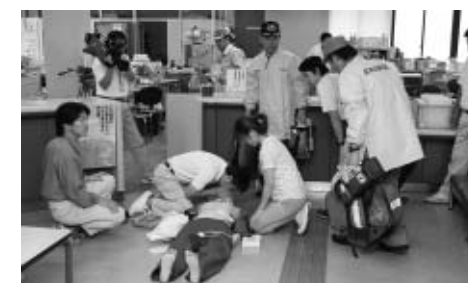
↑宮津与謝消防署救急隊と合同で訓練しました

九月九日から十五日までの「救急医療週間」期間中の九月十二日、野田川庁舎で救急訓練が実施されました。役場で救急患者が発生した場合に備えた今回の訓練は、一九番通報で救急車を要請し、心肺蘇生とAEDを使用した応急手当を実施し、救急隊が救急車で搬送するまでを行う本番さながらのもの。職員はもしもの時に備え、真剣な表情で取り組みました。