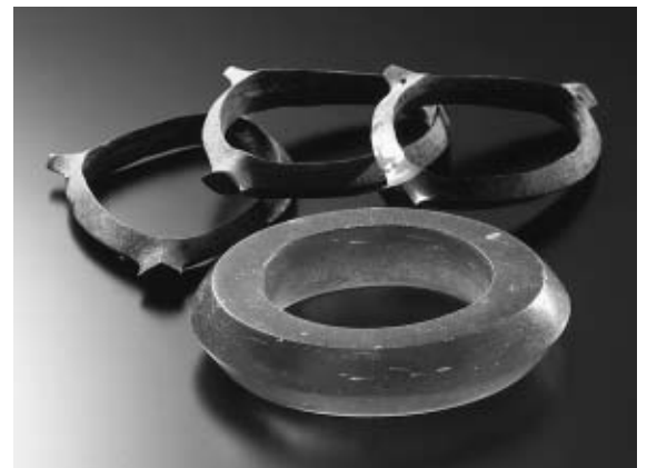
大風呂南1号墓出土のガラス釧と銅釧の一部 ●指定等/国指定重要文化財・平成13年6月22日指定・考古資料・弥生時代前期

風光明媚な天橋立とその懐に静かに佇む阿蘇海を東に見下ろす高台に十基の墳墓から構成される大風呂南墳墓群があります。その中で、日本で初めて完全な形で出土した青いガラスの腕輪（釧）、十三個の銅の腕輪、南西諸島からもたらされたゴホウラ貝でできた貝輪の一部、細かくきれいに磨かれた石製の首飾りなどの多彩な装飾品、十一本の鉄剣や、やじり、ヤスなどの豊富な鉄製品を副葬した一号墓は、弥生時代後期の邪馬台国の時代に遡る丹後地方のクニの王の存在を伺わせる歴史のロマンを感じさせます。