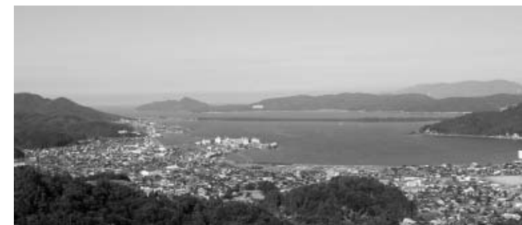
←与謝野町で対象地域となった大内峠から見る天橋立

今回の申請は、世界遺産に登録されるための第1関門である「国内暫定リスト」入りを目指すもので、すでに応募済みや昨年からの継続審査のものを含めると約30件の提案があります。今後は文化庁の文化審議会文化財分科会世界遺産特別委員会の審議を経て、年度内に暫定リストへの追加が決定されることになります。