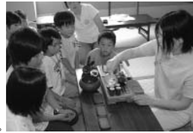
↑国際交流員事業「お茶クラブ」の様子

意味がわからなかったら、この表現が偉そうに見られてしまいますが、その逆で皇帝を尊敬するほどの気持ちでお礼をするという意味です。このような誤解は、異文化間の一つのおもしろさだと思います。