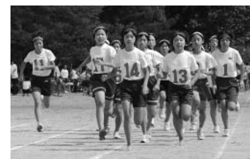
↑6年生女子800mの様子。今回の1位が大会記録となります

また岩滝地域と須津、府中地域の小学校がそれぞれ集まって記録会を開催していましたが、今年から新たに、与謝野町内の九小学校が集い、陸上競技力の向上と日頃の成果を交流し合う記録会として開催されることになりました。