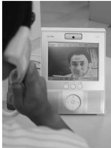
↑各庁舎に設置されたテレビ電話

希望される方には、各庁舎とも相談室等の個室を準備しています。プライバシーに十分配慮していますので、安心してご利用ください。