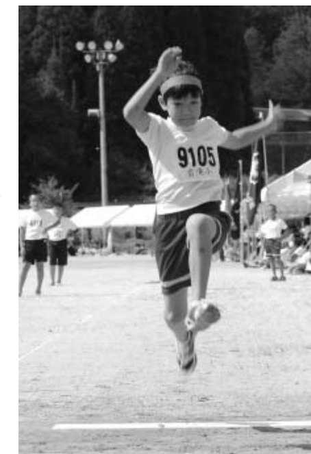
↑自己ベストに挑戦。5年生男子走り幅跳びの様子

雲ひとつない秋晴れの空のもと、「与謝野町小学生陸上記録会」が九月二十六日、野田川グラウンドで開催されました。これまで、加悦地域と野田川地域の小学校が、